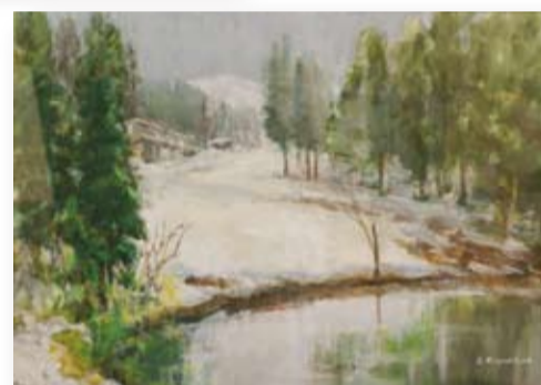
「魚沼の春」 宮内 哲