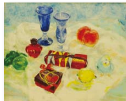
「インコのいる静物」 布井登茂子