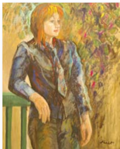
「光の中で」 友石 操